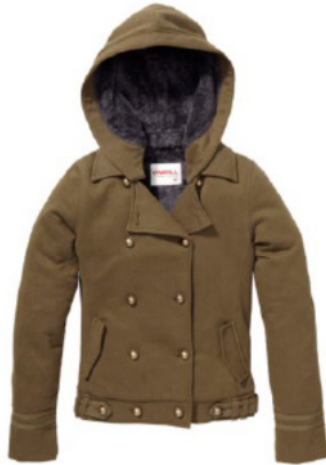
ELLIS FLEECE (156112)

EIN INNOVATIVES FLEECE , DAS DICH IN JEDER LEBENSLAGE VOR DEN NATURGEWALTEN SCHÜTZT UND DICH ZUDEM NOCH GUT AUSSEHEN LÄSST. DER ALLROUNDER ALS MODISCHER LANGER PARKA GESCHNITTEN ODER AUCH IN KÜRZERER FORM MIT MILITÄRMUSTER SORGT SELBST AN KÄLTESTEN WINTERTAGEN FÜR ABSOLUTE WÄRME. (Bild: Ellis Fleece braun oder schwarz, Art-Nr. 156112, CHF 219.- / Henning Fleece, Art-Nr. 156118, CHF 259.-)