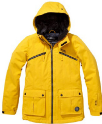
FREEDOM ONYX JACKET (155020)

SCHLUSS MIT DUNKLEN UND TRISTEN WINTERTAGEN! MIT DEN FRISCHEN UND FRÖHLICHEN FARBEN WIRD IM NU FRÖHLICHES GRINSEN IN EIN JEDES GESICHT GEZAUBERT. (Bild: Onyx Jacket, Art-Nr. 155020, CHF 379.- / Beetle Jacket, Art-Nr. 168002, CHF 379.- / Moonstone Fullsuit, Art-Nr. 155048, CHF 449.-)