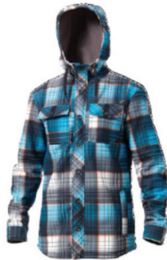
ALFABRAVO HYPERFLEECE (150305)

DAS ANSPRUCHSVOLLE FLEECE IM STIL EINES FLANELLHEMDS MACHT EINEN JEDEN MANN GLÜCKLICH UND SCHÜTZT VOR EISKALTEN NATURGEWALTEN. (Bild: Alfabravo Hyperfleece, Art. Nr. 150305, CHF 219.-)