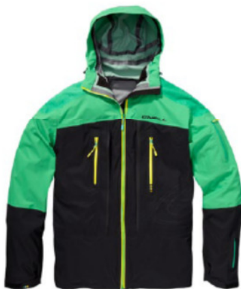
EXPLORE JONES SLAYER JACKET (150000)