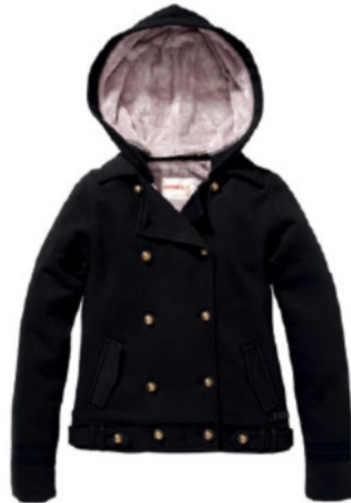
ELLIS FLEECE (156112)