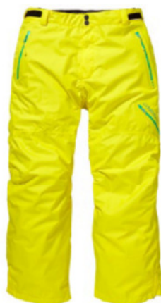
EXPLORE JONES SLAYER PANT (153008)