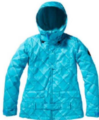
FREEDOM BEETLE JACKET (168002)