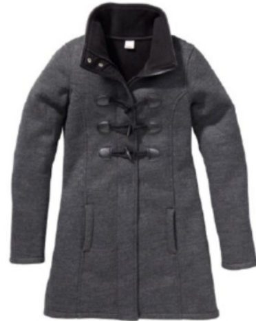
HENNING FLEECE (156118)