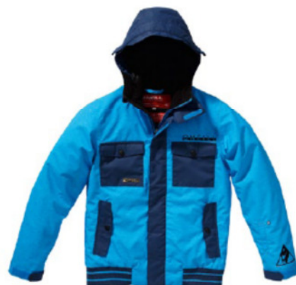
FREEDOM SEB TOOTS JACKET (150032)